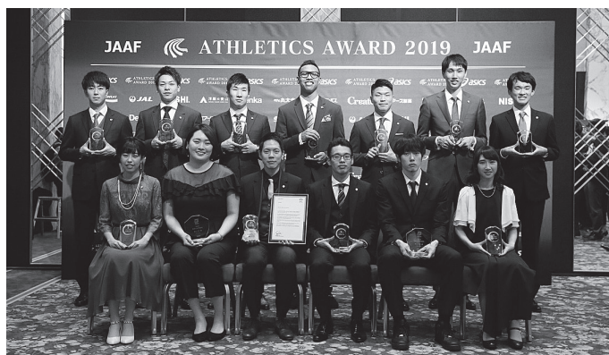
アスレティックス・アワード2019より