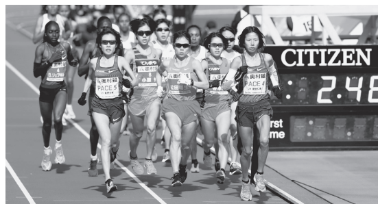
昨年度の大会より